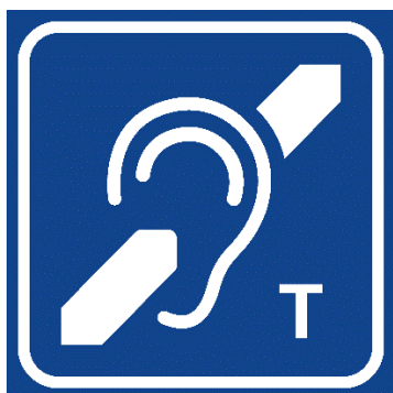
Rysunek 2 Symbol pętli indukcyjnej