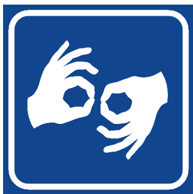
Rysunek 1 Przykład piktogramu tłumaczenia na język migowy.